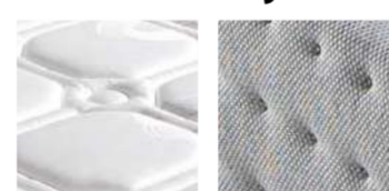
tabla de puntos polipiel/luxe