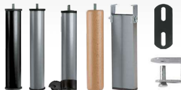
Patas Métrica 10