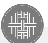
TEJIDO STRECH 20% VISCOSA 80% PES