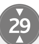
ALTURA APROX. 29