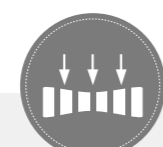
INDEPENDENCIA DE PESO