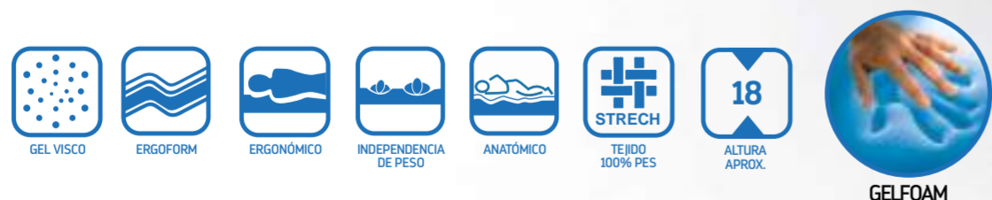
tabla de puntos

Tejido de alta protección gracias a su tratamiento de tecnología de control Insecta TM, de propiedades anti-mosquitos y repelente de insectos, de alta actividad anti-acaros y polilla, especialmente anti-larva, sensible al medio ambiente aplicando la tecnología más ecológica del mercado. Aplicado a un tejido de alto gramaje y calidad de malla de gran elasticidad y tacto suave proporcionando un alto confort.