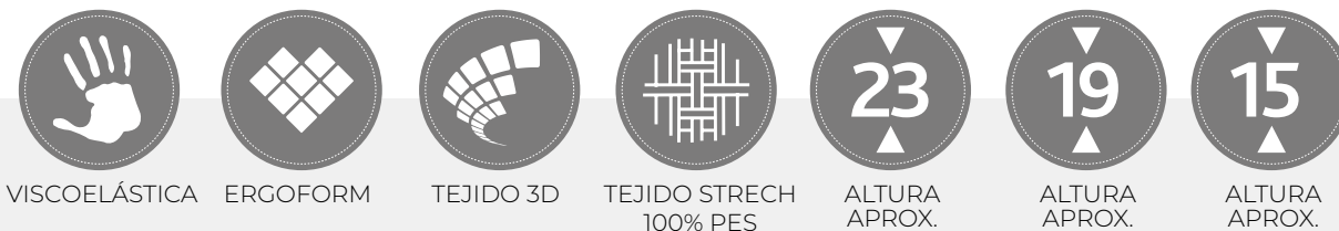
VISCOELÁSTICA ERGOFORM TEJIDO 3D TEJIDO STRECH 100% PES ALTURA APROX. ALTURA APROX. ALTURA APROX.