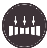
INDEPENDENCIA DE PESO