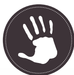
VISCOELÁSTICA 2 CARAS