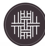
TEJIDO STRECH 100% PES