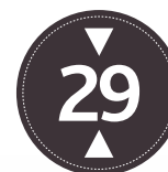
INTERIOR EXTRA 29