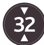
ALTURA APROX. 32