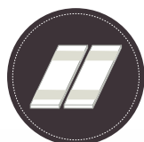
LAMAS CON REGULADOR