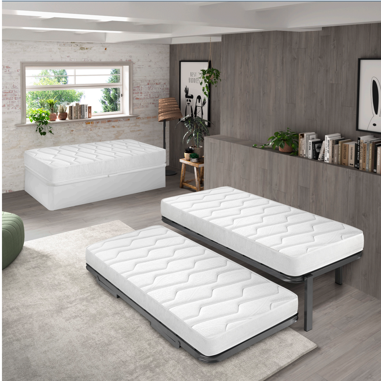
* Top Visco 23 / 19 / 15